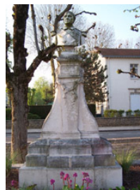
Amiral Jauréguiberry Exécutée par Mr Rollar