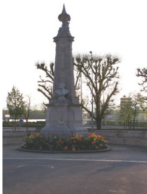
Gambetta Exécutée par Mr Loiseau Bailly

Ces bustes représentaient les hommes de la défense nationale. Le maire était très embarrassé de ce cadeau qu'il ne savait pas où placer. Finalement les bustes furent remisés dans les sous-sols du collège jusqu'en 1902. A ce moment des pourparlers furent engagés avec les Beaux Arts pour obtenir une subvention qui aiderait à mettre les bustes en place dans un square à établir au bas de la Grande allée, ce qui fut fait.