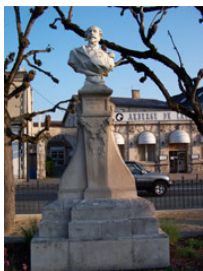
Général Chanzy Exécutée par Mr Hugoulin,)

Une lettre du ministre des Beaux Arts d'août 1897 annonça l'envoi de 5 bustes en marbre pour la décoration des Promenades :