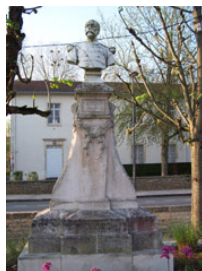
Général Faidherbe Exécutée par Mr Icard